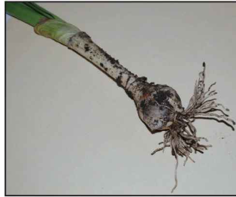
Un bulbe de jonquille sorti de terre