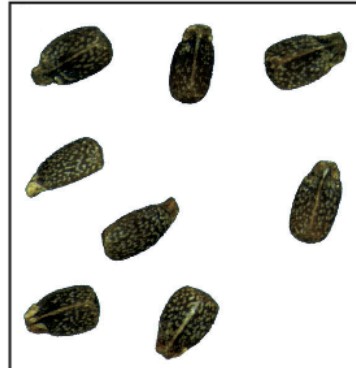
Des fruits de lamier pourpre