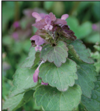
Un lamier pourpre en fleurs

Utilise les informations apportées par le document suivant pour répondre aux questions.