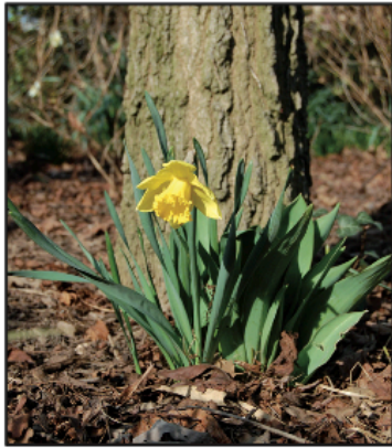
Une jonquille en fleur

Lis attentivement le document ci-dessous puis réponds aux questions.